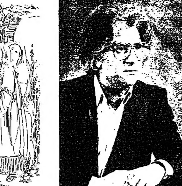
رسم زهرا روحانية الايمان